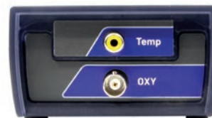
Pannello connettori OXY 7 Vio

Il modello XS OXY 70 Vio invece utilizza un senore ottico , disponibile in due versioni: cavo di lunghezza 2 m o 10 m .