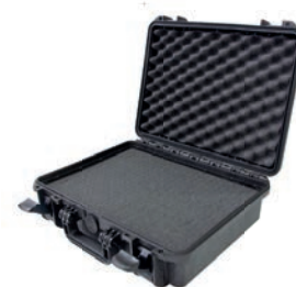
Valigia IP 67 optional cod. 50010972