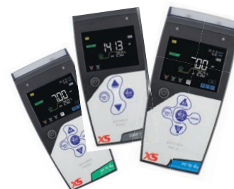
Conduttimetri e Multiparametri